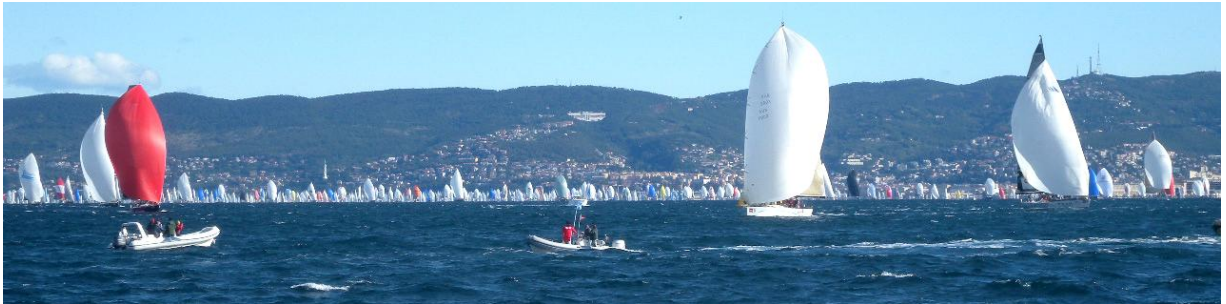
Trieste - Barcolana 2011