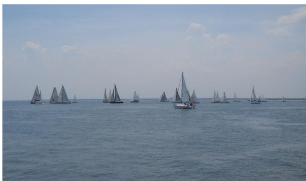
Marinara 12 giugno 2011 - "TuttIMBARCabili"